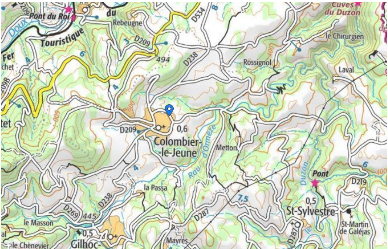
Extension de la commune de COLOMBIER-LE-JEUNE sur fond IGN