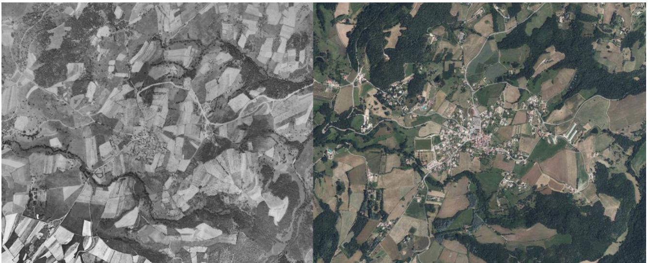
Photographie aérienne du Nord de COLOMBIER-LE-JEUNE de 2024